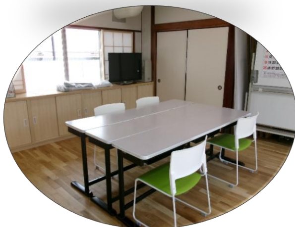
団体での活動にもご利用ください。