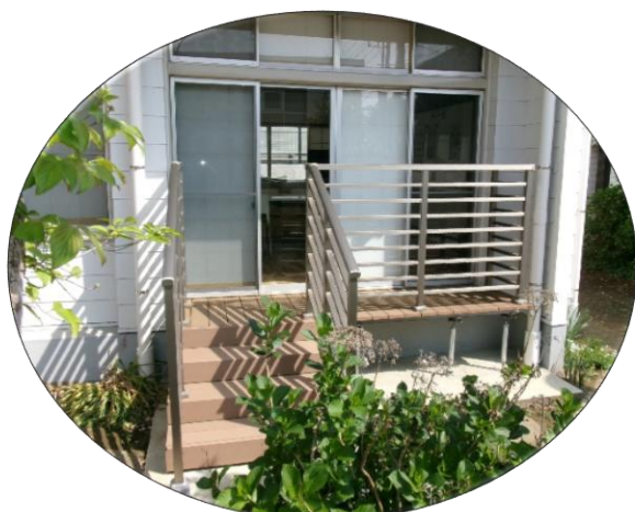
日当たり良いのデッキ