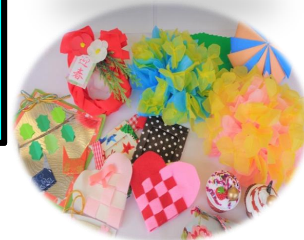
さまざまな作品作りも行っています。 (自主事業ゆうゆうサークル)