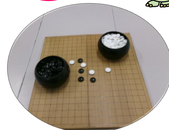
囲碁や将棋もできます。